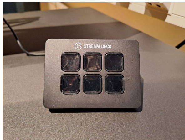
Bilder från inspelningsstudion.